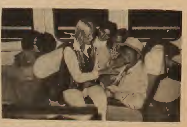
The word "participation" needs to be grasped in concrete terms here.