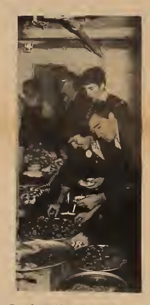
The French-Canadian delegation living it up!