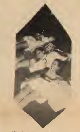
That's how it all ended ...