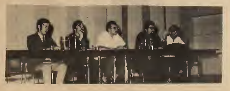
The teach-in on the Canadian Student Movement and social change