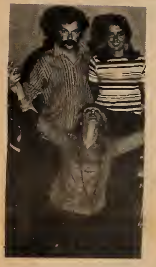
A convert to the movement...