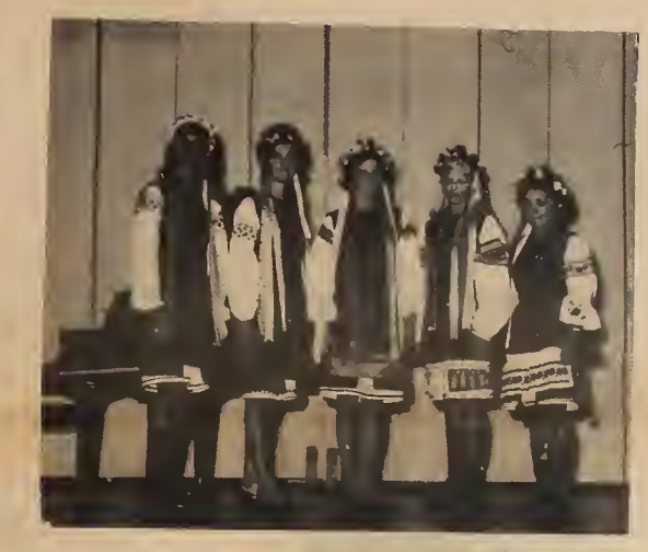
Мені ворожка ворожила...