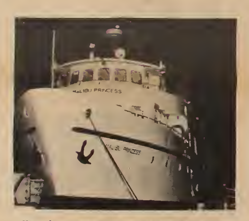
Upon the turgid waters of Vancouver they ventured ...