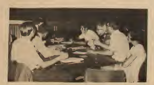
Політична комісія на Конґресі дискутує